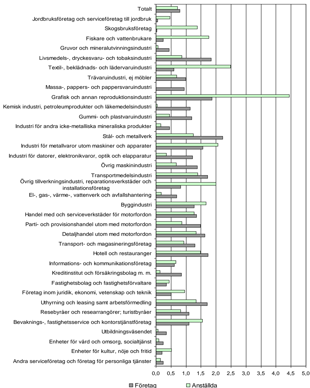
Figur 3 Antal företagskonkurser och anställda berörda av konkurs i förhållande till företagsstocken 2009 efter bransch, procent

Inom Tillverkningsindustrin (exklusive Gruvor och mineralutvinningsindustri) ökade antalet konkurser med 46 procent och antalet anställda berörda av konkurser med 70 procent. Inom Byggindustrin uppgick motsvarande förändringar till ökningarna på 17 respektive 46 procent. Inom Tjänstenäringarna ökade konkurserna med 16 procent, och antalet anställda berörda av konkurs med 45 procent. Inom Handeln uppgick ökningarna till 20 och 48 procent för antal företag respektive antal anställda.